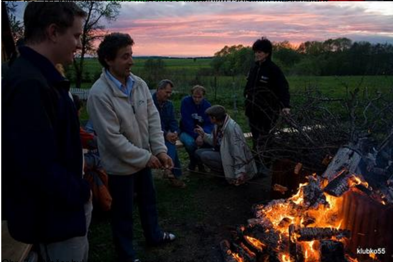
Obr. 7 - večer byl čas i na posezení u ohně