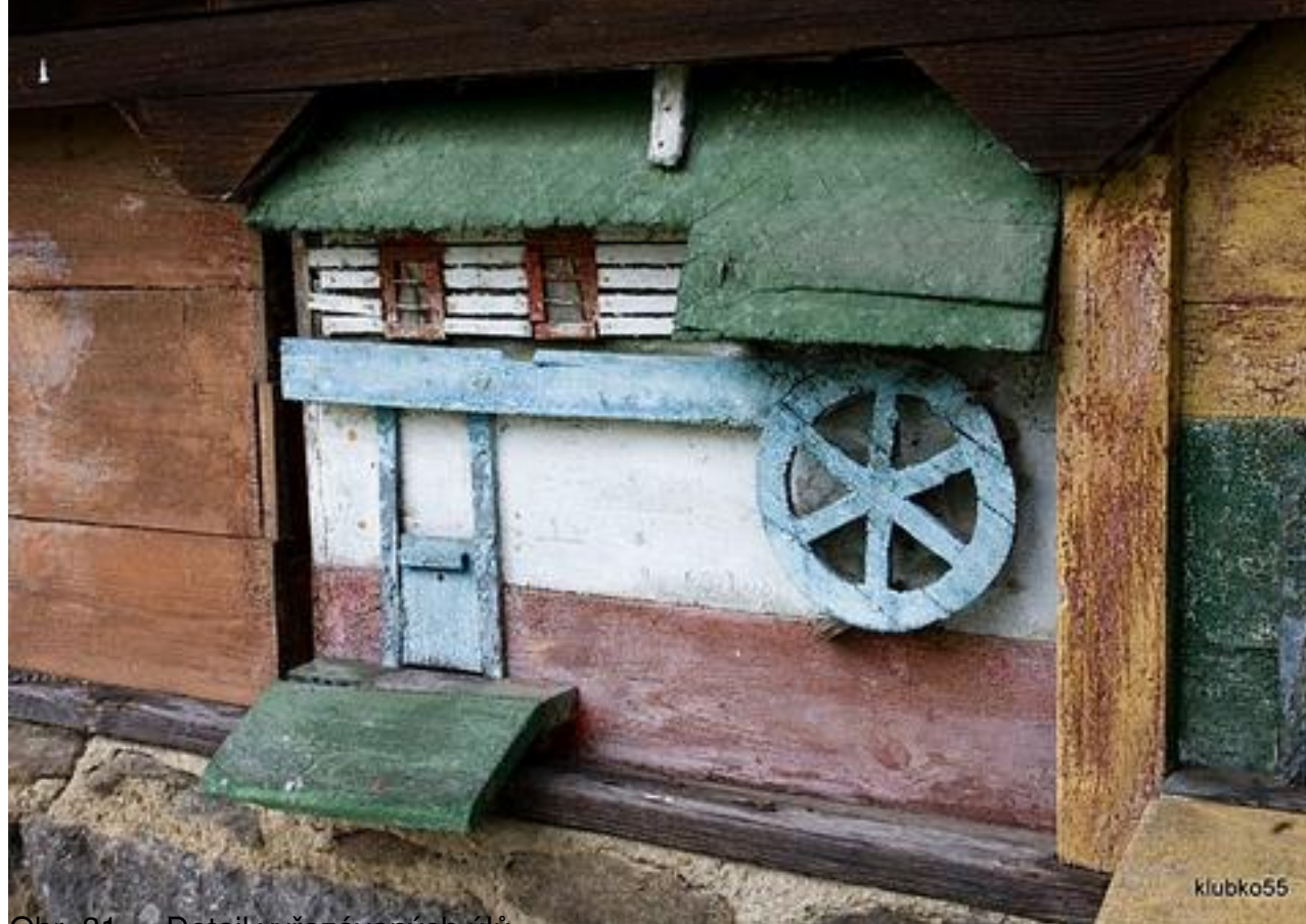
Obr. 31 – Detail vyřezávaných úlů Pokračování přineseme brzy