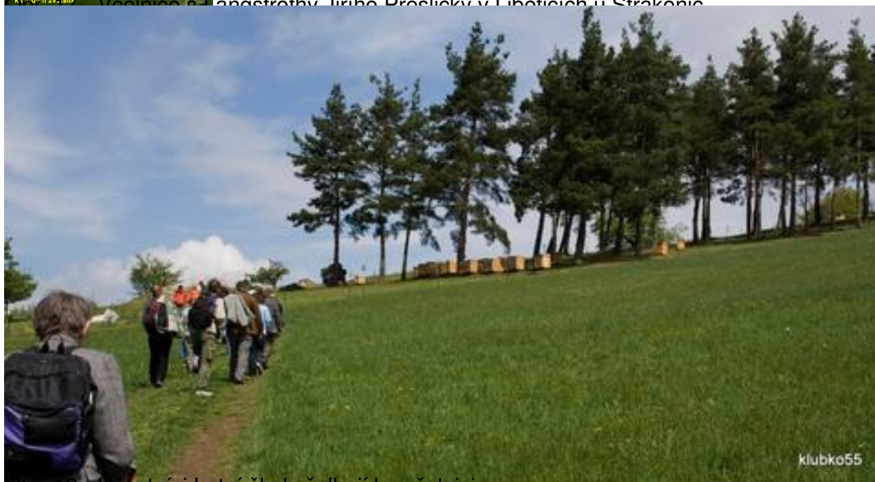
Obr. 18 - Účastníci Letní školy šplhají ke včelnici