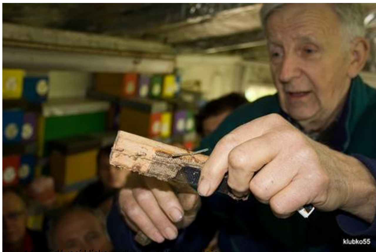
Obr. 14 - Přidávací klíčka podle slovinského včeláře