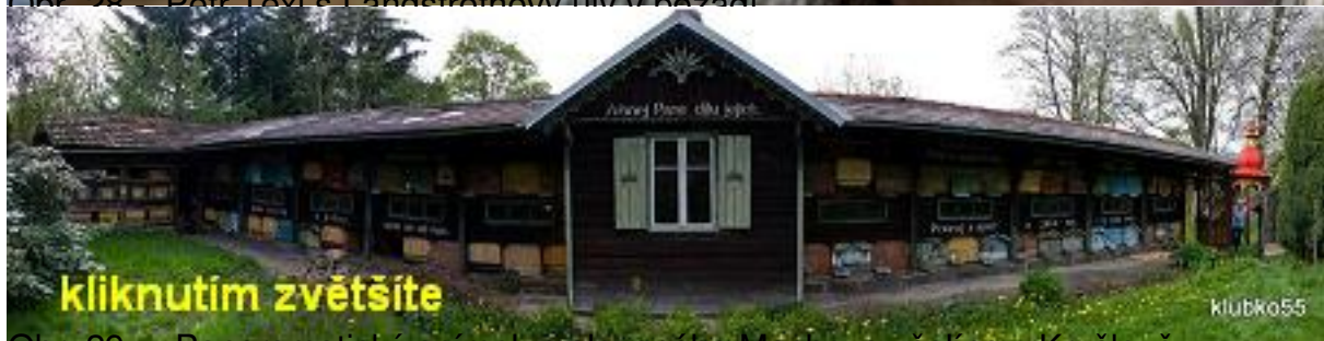
Obr. 29 - Panoramatický snímek malovaného Machova včelína v Krušově