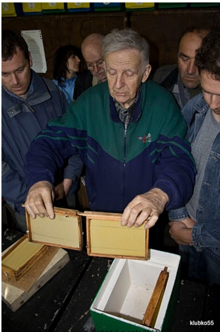
Obr. 13 - Ukazka spojování rámků z oplodňáčku