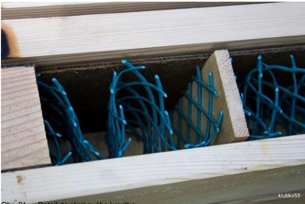
Obr. 21 – Detail do rámkového krmítka

Napsal uživatel Ing. Petr Texl Neděle, 16 Květen 2010 18:13