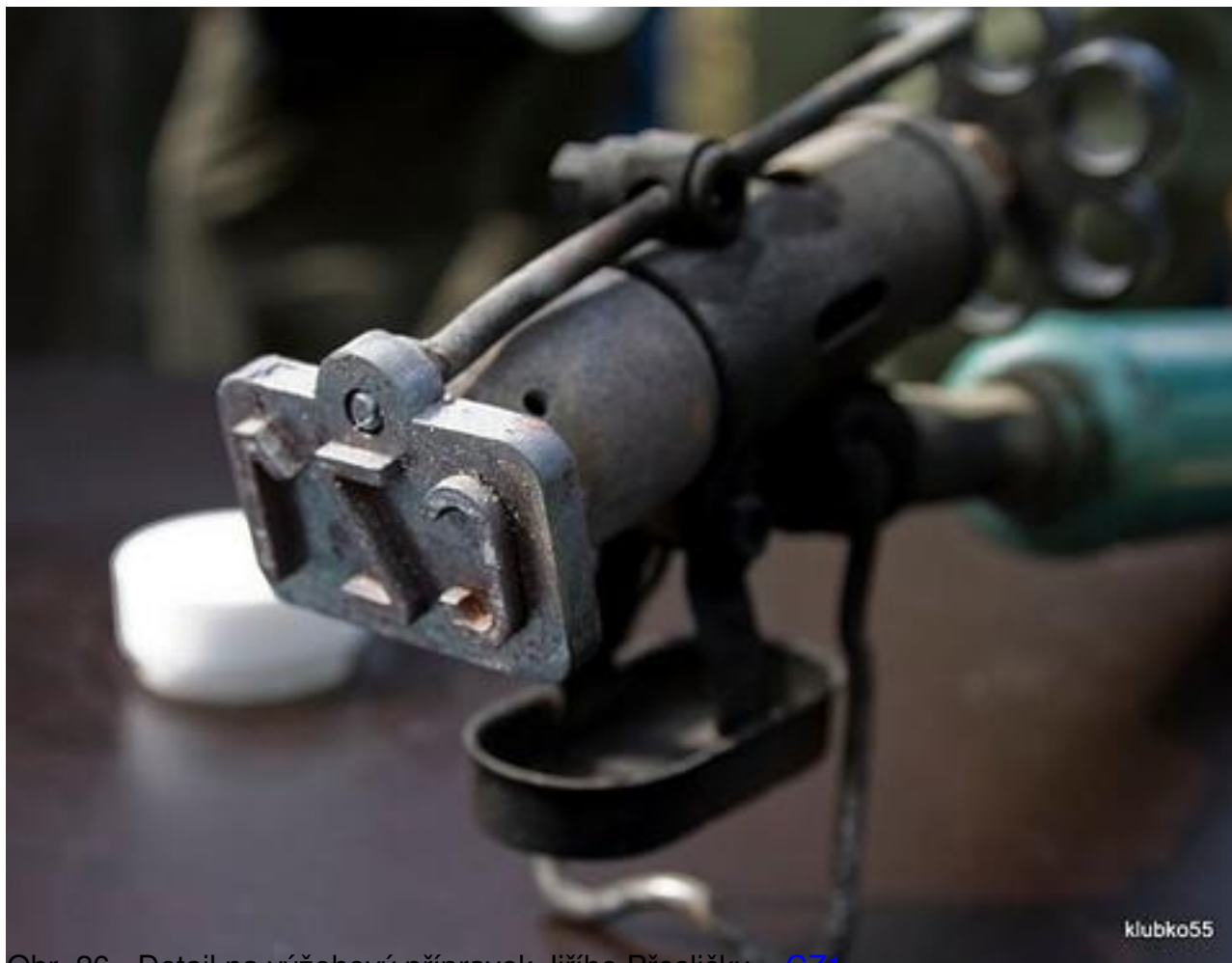
Obr. 26 - Detail na výžehový přípravek Jiřího Přesličky - GZ1