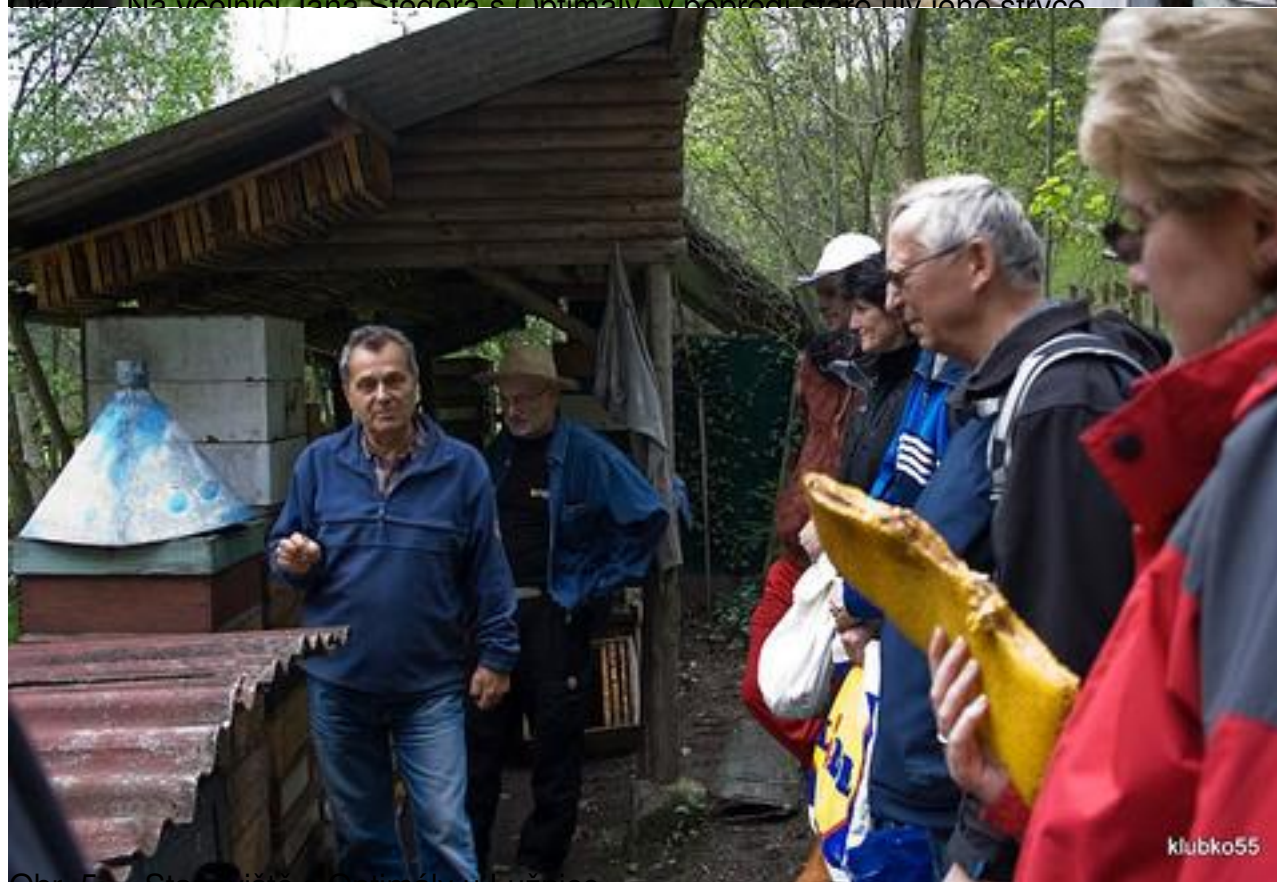
Obr. 5 - Stanoviště s Optimály u Lužnice