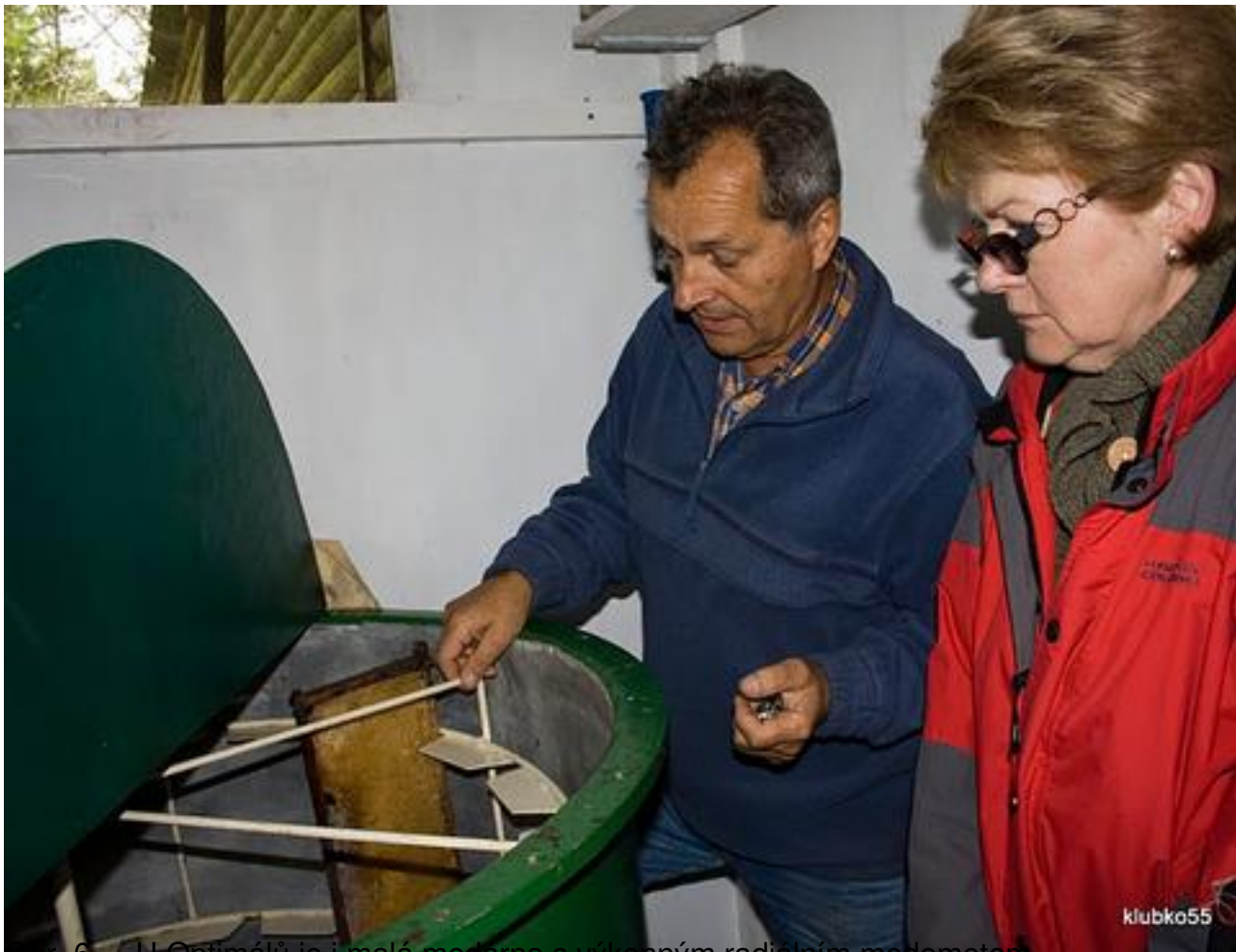
Obr. 6 - H. Ontimáří je i malé medárna s výkonným radiálním medometem

Napsal uživatel Ing. Petr Texl Neděle, 16 Květen 2010 18:13