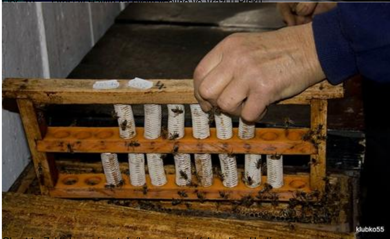
Obr. 11 - Zaklíčkové matečníky v provedení Jaroslava Havlína