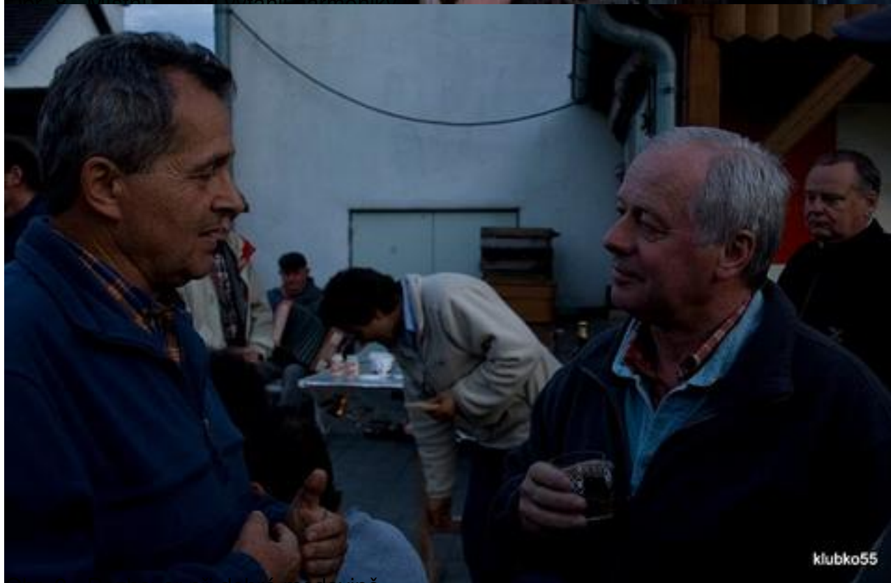
Obr. 5 - Rozhovor při dobré medovině