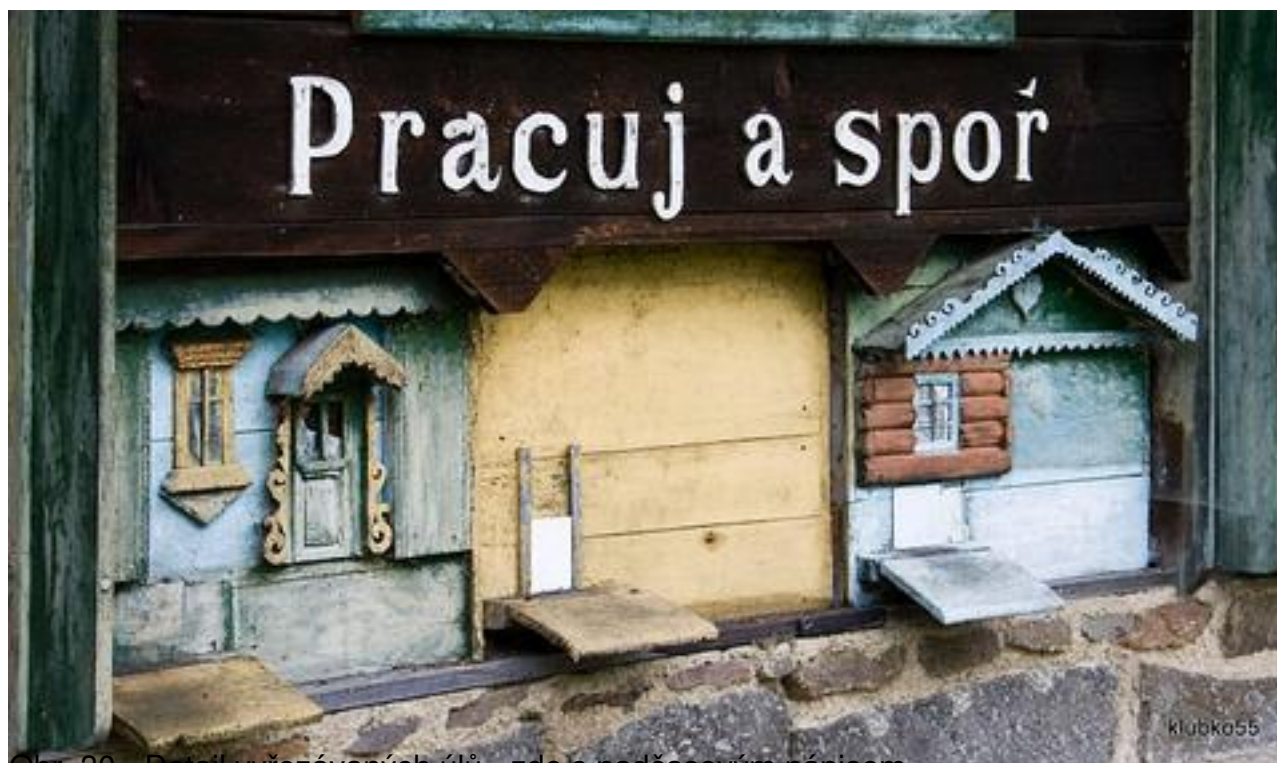
Obr. 30 – Detail vyřezávaných úlů – zde s nadčasovým nápisem